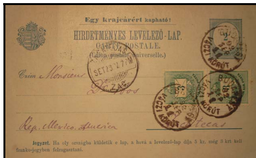
Abb. 8: Noch zum Seepostporto freigemachte Werbeganzsache nach Mexiko vom 11. September 1892. 9

Aus Unkenntnis über die Abschaffung des Seepostos wurden auch nach dem 31. Mai 1892 noch Poststücke zum Seeposttarif freigemacht.