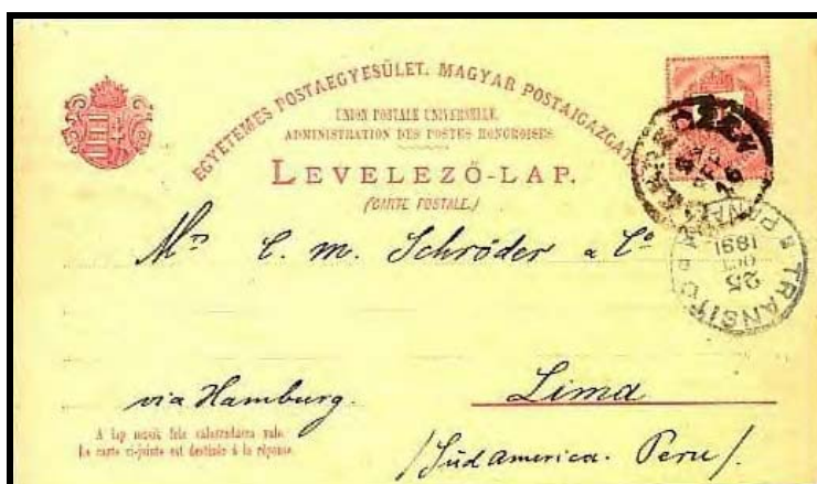
Abb. 4: Ganzsachenfrageteil nach Peru vom 16 September 1891 mit fehlender Frankatur, aber ohne Nachporto. 5