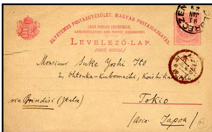
Abb. 3: Postkarte nach Japan vom 24 Januar 1891 mit fehlender Frankatur, aber ohne Nachporto 4 .