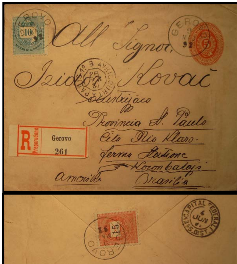
Abb. 7: Eingeschriebener Brief nach Brasilien vom 9. Mai 1892. Die Rekogebühr betrug 10 Kr, so dass diese Ganzsache portogerecht frankiert ist. 8

Aus Unkenntnis über die Abschaffung des Seepostos wurden auch nach dem 31. Mai 1892 noch Poststücke zum Seeposttarif freigemacht.