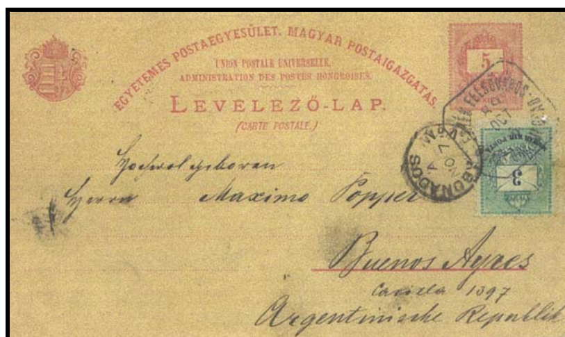
Abb. 1: Postkarte nach Argentinien vom 5 Oktober 1889 mit Zusatzfrankatur. 2

Anhand einiger Belege wird dieses besondere Porto vorgestellt. Dabei wird auch gezeigt wie wenig bekannt diese „See-Taxe“ war.