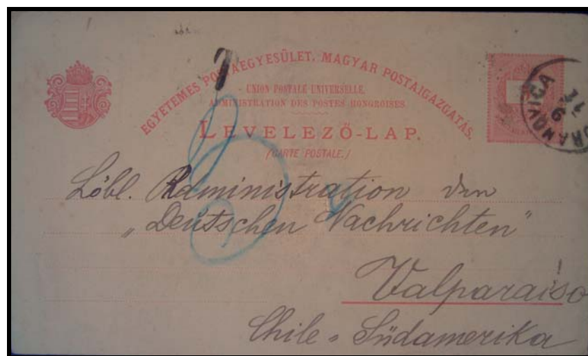
Abb. 6: Postkarte nach Chile vom 9. November 1891 mit fehlender Frankatur, aber mit Nachporto. 7