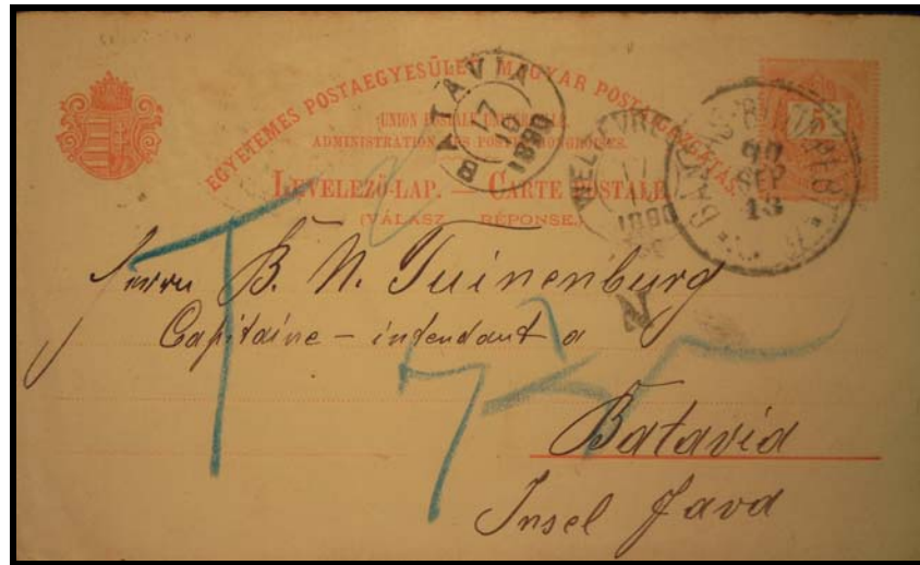
Abb. 5: Postkarte nach Batavia (Niederländisch Indien) vom 13. September 1890 mit fehlender Frankatur, aber mit Nachporto. 6

Anhand dieser Auslandpostkarten erkennt man bereits die unterschiedlichen Kenntnisse der Beamten in Budapest (korrekt) und Debreczen. Es lassen sich natürlich auch mit Nachgebühren belegte Poststücke nachweisen. In den beiden gezeigten Fällen fehlt nur der Seepost-Anteil im Porto.